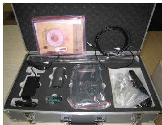
非金属超声检测分析仪 NM-4B